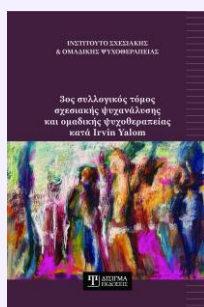
3ος συλλογικός τόμος Σχεσιακής Ψυχανάλυσης & Ομαδικής Ψυχοθεραπείας Συλλογικός τόμος, 2025