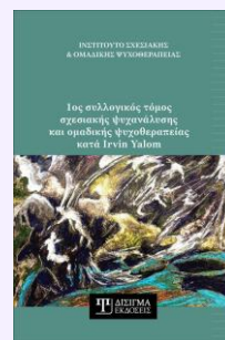
1ος συλλογικός τόμος Σχεσιακής Ψυχανάλυσης & Ομαδικής Ψυχοθεραπείας Συλλογικός τόμος, 2023