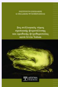
2ος συλλογικός τόμος Σχεσιακής Ψυχανάλυσης & Ομαδικής Ψυχοθεραπείας Συλλογικός τόμος, 2024