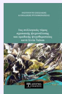
1ος συλλογικός τόμος Σχεσιακής Ψυχανάλυσης & Ομαδικής Ψυχοθεραπείας Συλλογικός τόμος, 2023