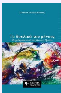
Τα Δουλικά του μένου Ατομικό έργο, 2025