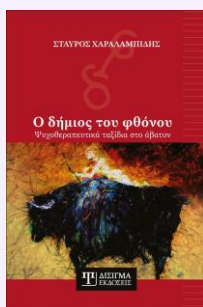
Ο Δήμιος του φθόνου Ατομικό έργο, 2022

Οι παρακάτω εκδόσεις συγκροτούν τον βασικό εκδοτικό κορμό που πλαισιώνει τη θεωρητική και κλινική ταυτότητα του Ι.Σ.Ο.Ψ. Αξιοποιούνται συμπληρωματικά στο θεωρητικό και κλινικό σκέλος του προγράμματος, ως ενδεικτικοί άξονες μελέτης και θεσμικής ταυτότητας.